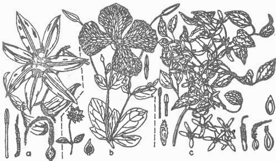
Figura 6 - a - Clematis patens ; b - C. viticella ; c - C. paniculata

C. patens Morr. et Decne. - Liană agățătoare, până la 2(-4)m lungime, cu frunze ternate sau penate. Foliiole 3-5, ovat-lanceolate, de 4-10 cm lungime, acute, cu baza de regulă rotunjită, întregi și pe dos pubescente. Flori violet, solitare la vârful ramurilor laterale, de 10-15 cm lățime. Tepale 6-8. Bracteele de la baza pedunculului floral lipsesc. Achenele au stilul plumos, aproape de vârf pubescent. Fl. V-VI. Fig. 6 a.