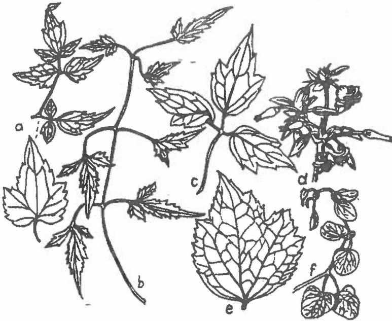
Figura 2 - a: Clematis brevicaudata (forme de frunze); b: C. tangutica (idem); c: C. virginiana (idem); d, e - C. stens (d - porțiune de inflorescență; e - frunză); f - C. texensis (frunză)

Răsp. gen.: din Manciuria până în vestul Chinei.