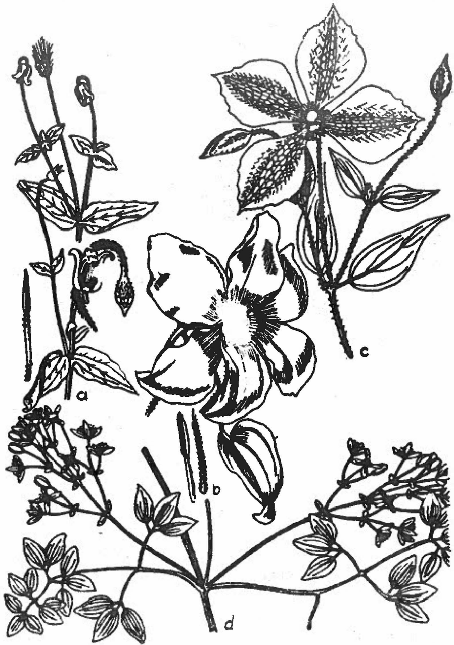
Figura 4 - a - Clematis vitalba ; b - C. lanuginea ; c - C. x jackmanii ; d - C. flammula