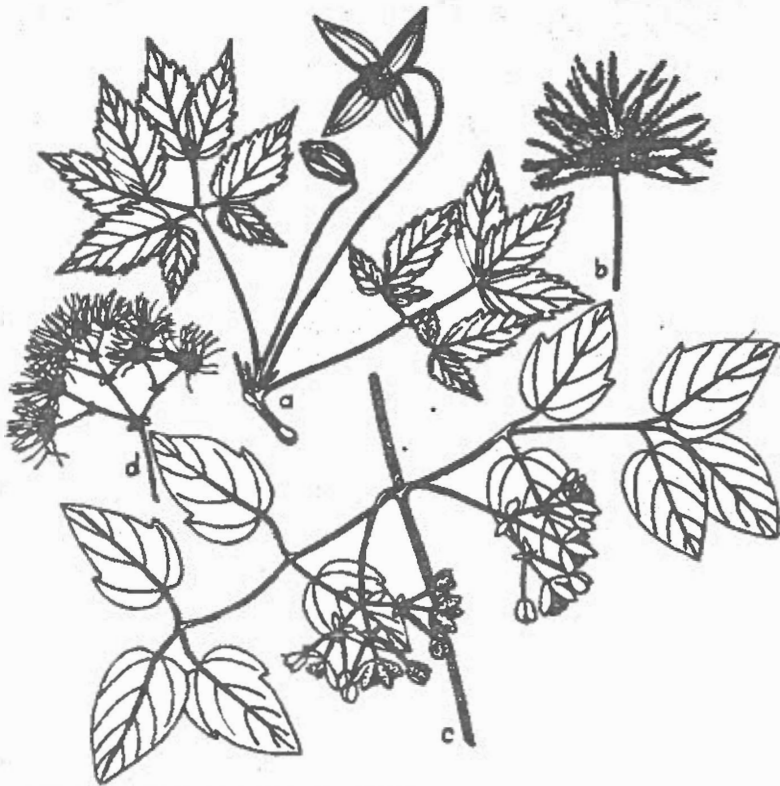
Figure 1 - a, b - Clematis alpina (ramură cu frunze, flori și fructe); c, d - Clematis vitalba (idem)

C. alpina (L.) Mill. (= Atragene alpina L.) - Liană agățătoare sau volubilă de 1 (3) m lungime. Frunze ternate sau biternate cu foliolele de ordinul I lung pețiolate, iar cele de ordinul II scurt pețiolate sau aproape sesile, ovat-lanceolate, de 2-5 cm lungime, incis-serate, pe dos slab pubescente. Florile, de obicei solitare, sunt campanulate,