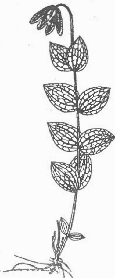
Figura 5 - Clematis integrifolia

C. x jackmanii Moore ( C. lanuginosa x C. viticella ) - Liană agățătoare de 3-4 m lungime. Frunze penate, cele superioare adesea simple, cu foliole lat-ovate, acuminate, întregi, glabre sau pe dos pubescente, de 10-12 cm lungime. Flori de regulă câte 3 la vârful lujerilor din anul curent, de 10-14 cm în diametru. Tepale 4-6, obovate, violet-purpurii. Pedunculul florilor lung de 10-14 cm.