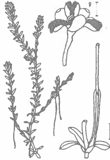
Fig. 2 - E. canadensis Michx.