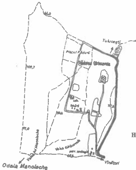
Harta rezervației - Pădurea Gârboavele (jud. Galați)