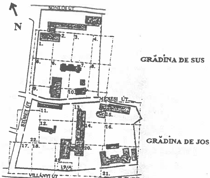
Fig.2 – Organizarea arboretumului