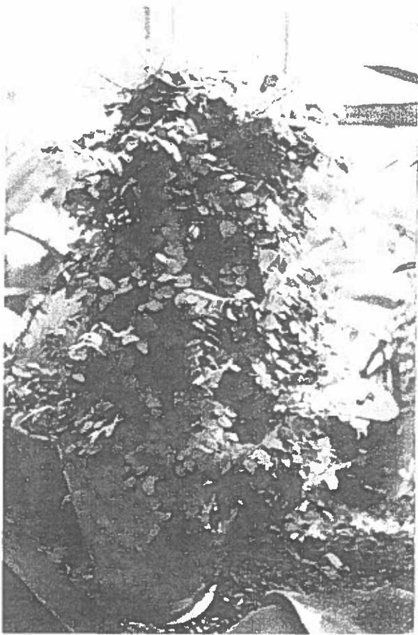
Fig. 5 - Ficus pumila L.