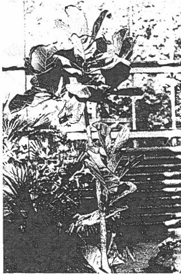
Fig. 4 - Ficus lyrata Warb.