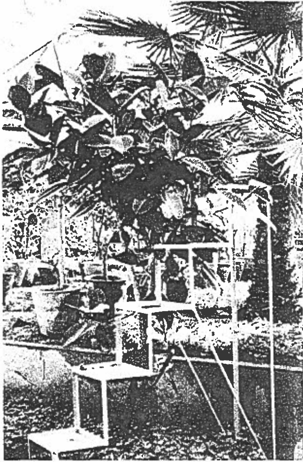
Fig. 3 - Ficus elastica Roxb. 'Rubra'