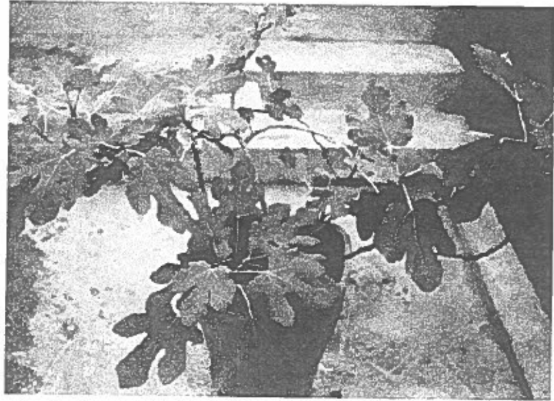
Fig. 2 - Ficus carica L.