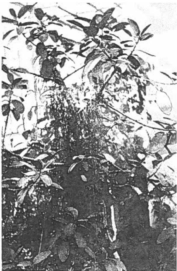
Fig. 7 - Ficus rubiginosa Desf.