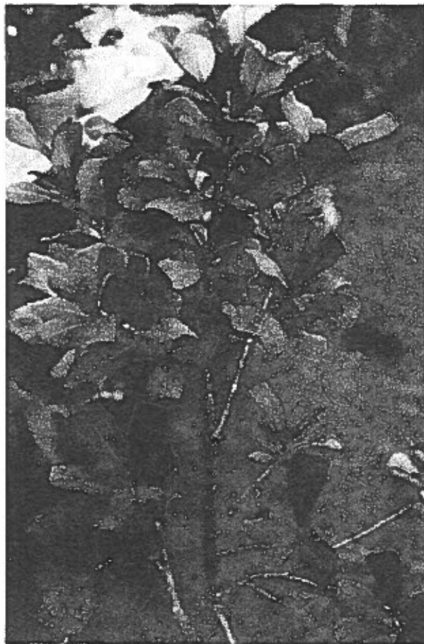
Fig. 8 - Ficus triangularis Warb.